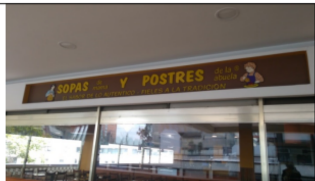
Fotografía No.2 Fachada del establecimiento.