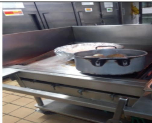
Fotografía No.6 Plancha de 4 puestos