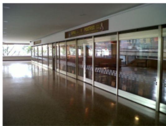
FOTOGRAFÍA 2: FACHADA DEL ESTABLECIMIENTO