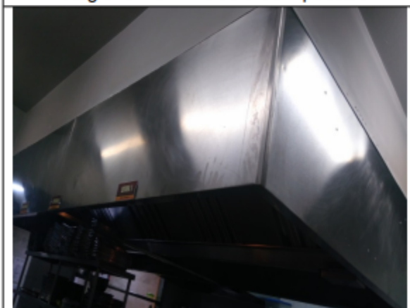
Fotografía No.9 Campanas extractoras