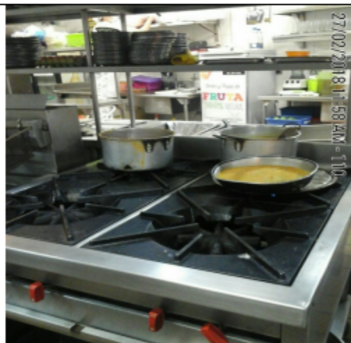
Fotografía No.4 Estufa de 4 puestos