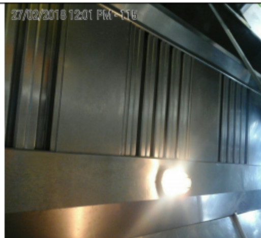
Fotografía No.8 Filtros de grasa