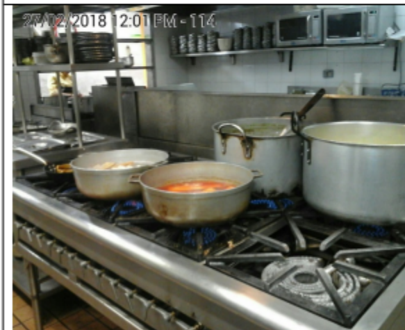
Fotografía No.3 Estufa de 8 puestos