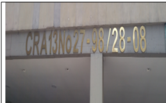
Fotografía No.1 Nomenclatura Urbana del establecimiento