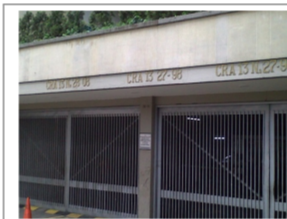
FOTOGRAFÍA 1: NOMENCLATURA.