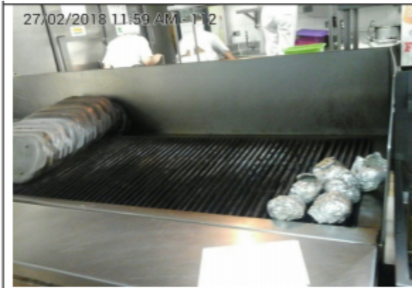
Fotografía No.5 Parrilla de 8 puestos