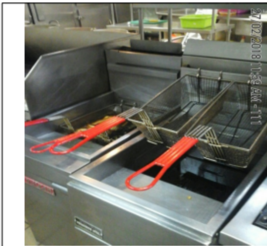
Fotografía No.7 Freidora de 4 puestos