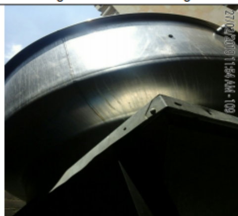
Fotografía No.10 Extractor tipo hongo.